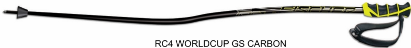
RC4 WORLDCUP GS CARBON