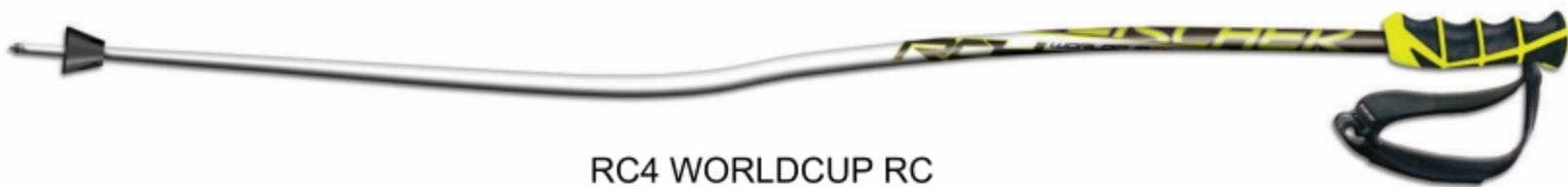
RC4 WORLDCUP RC

Цвят: бяло / жълто Материал: Алуминий КАЧЕСТВО: 7075 Вал: пречупени / армирани